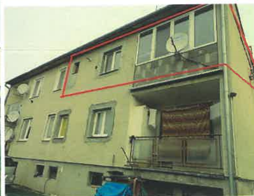
pohľad zadný na byt.dom