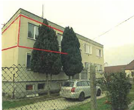
pohľad predný na byt.dom