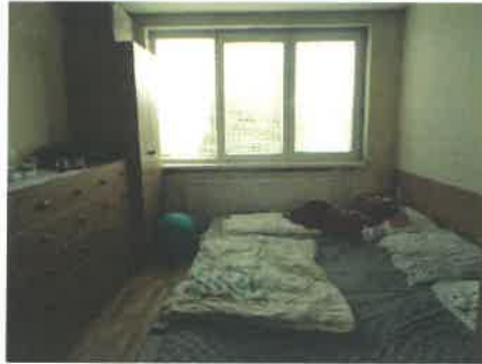
pohľad na izby v byte