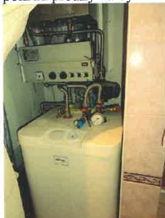
kotel a zásobník