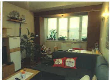
obývacia izba s krbovými kachľami