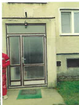
vstup do domu